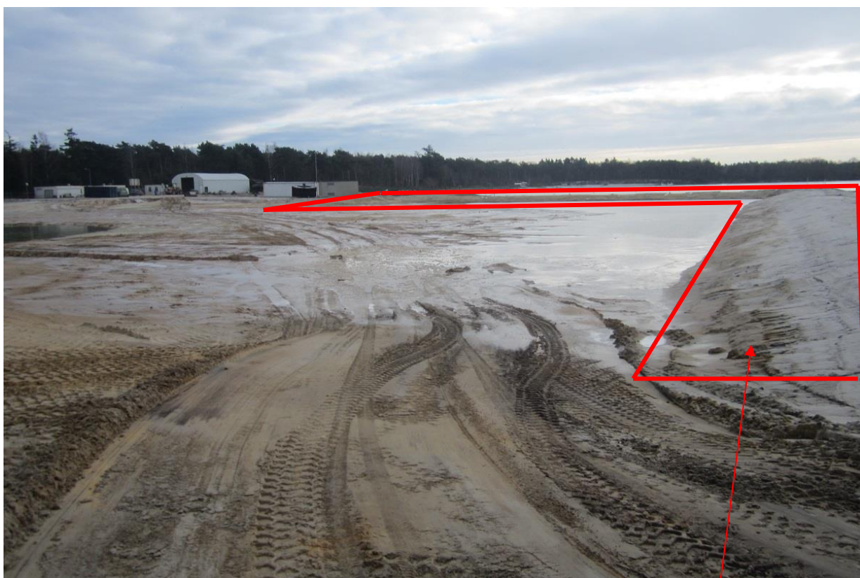
Foto 6: De afwerking van deelgebied 1C voldoet door de aanwezigheid van elektriciteitsleidingen en verharding en bebouwing (linksboven op de foto) niet aan het eindplan