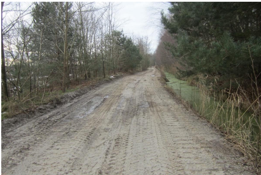
Foto 4: In het deel van deelgebied 1A dat conform het eindplan afgewerkt en ingericht moet zijn als droge heide loopt een werkweg