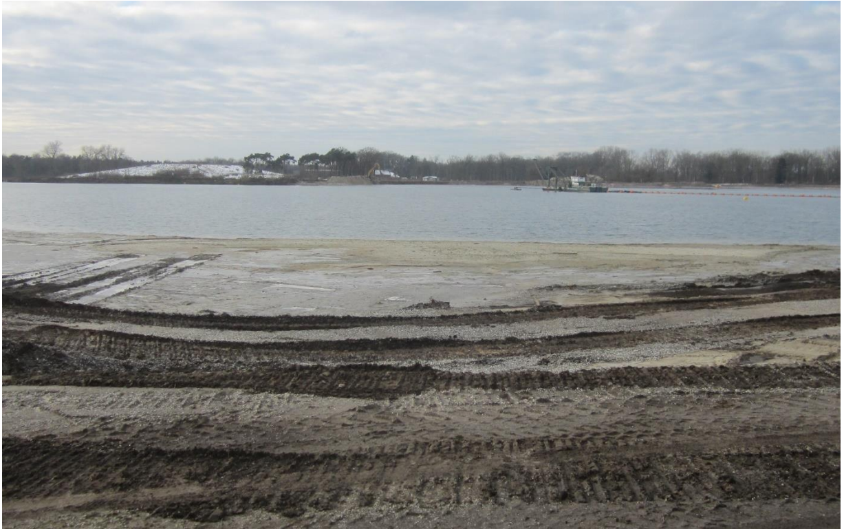
Foto 9: in deelgebied 5 (duikplas) worden nog modelleringswerkzaamheden uitgevoerd, het deelgebied is niet afgewerkt en ingericht conform het eindplan