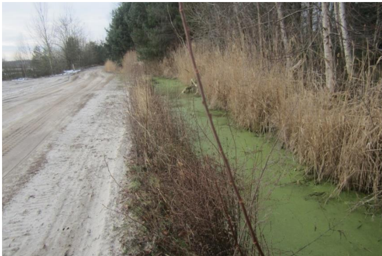
Foto 1: Watersloot (infiltratiesloot) in het oostelijk deel van de locatie is watervoerend en heeft infiltrerende capaciteit en werking