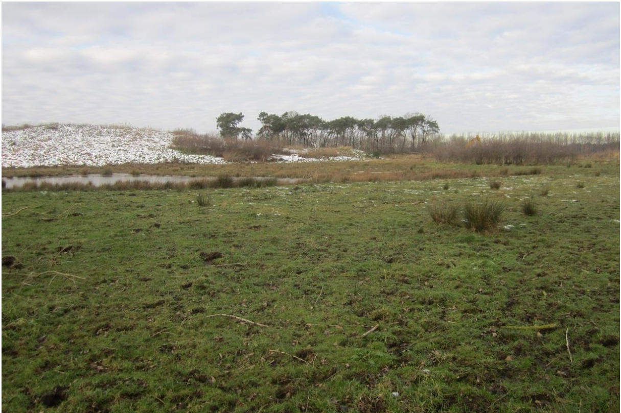
Foto 11: overzichtsfoto van deelgebied 6, een onvergraven zone (natuurstrook straalbedrijf Cuijpers)