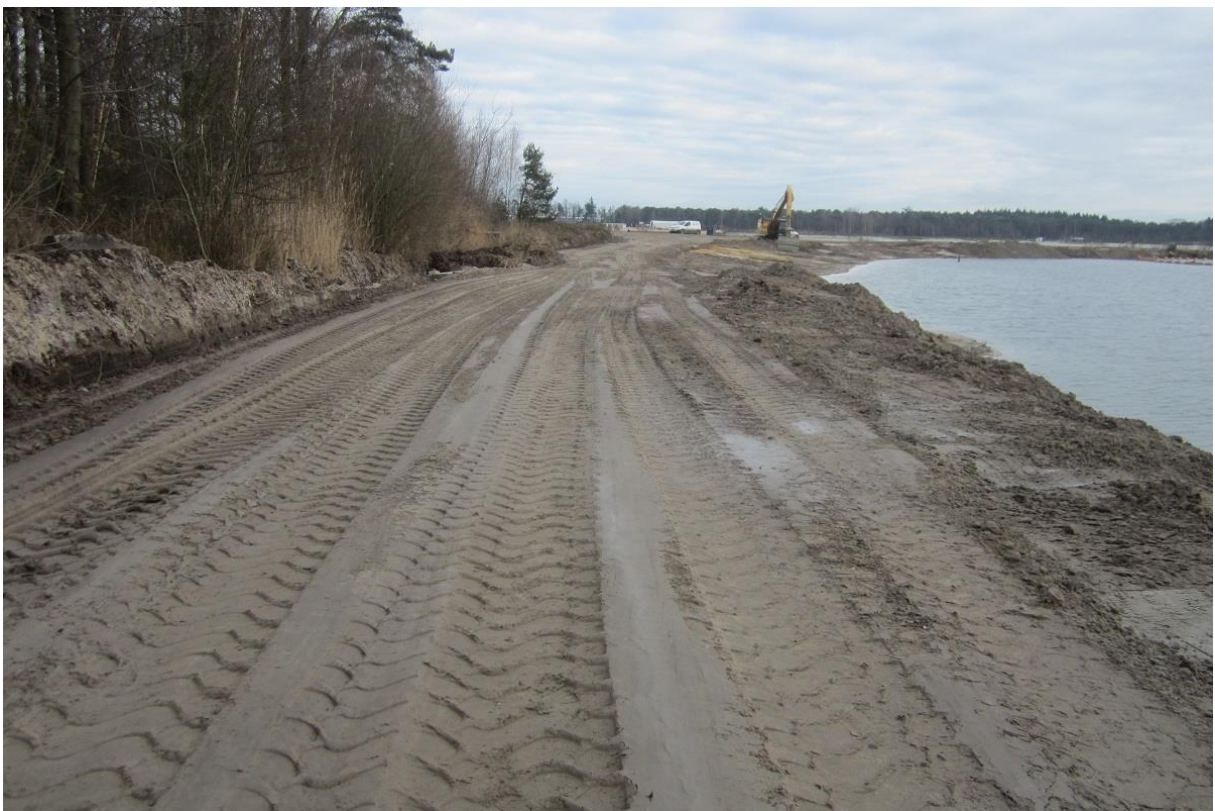
Foto 12: Het noordelijk talud van de duikplas wordt hersteld zodat de watersloot weer aangelegd kan worden en watervoerend wordt en daarmee in werking treedt volgens voorschrift 3.5