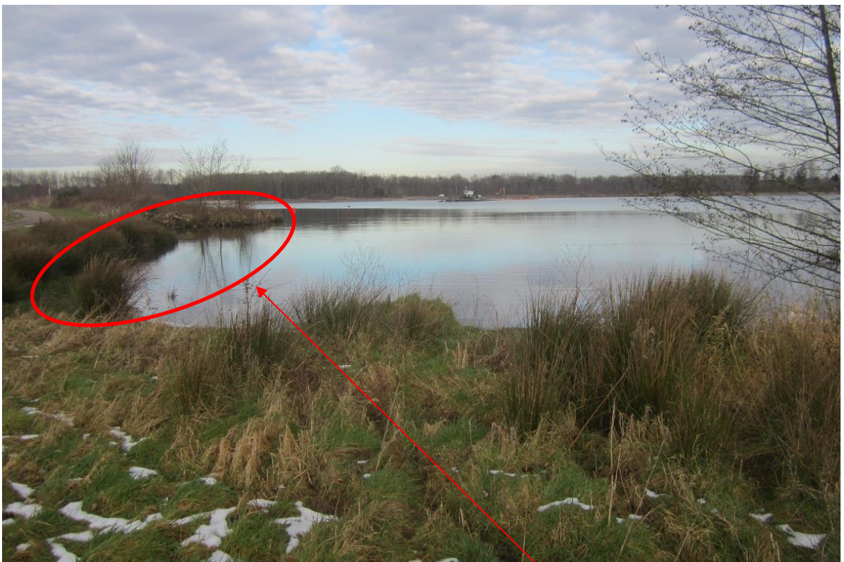
Foto 10: in de zuidwestelijke hoek van de duikplas staat de oever onder water zodat deze niet afgewerkt kan worden