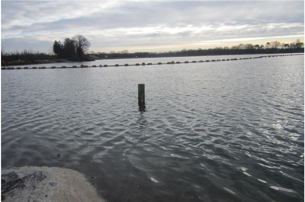
Foto 2: In de westelijke duikplas is een peilschaal geplaatst die aan NAP gekoppeld is

Jaarlijks dient de vergunninghouder een interpretatie en rapportage van de monitoringsrapportage aan Gedeputeerde Staten te overleggen.