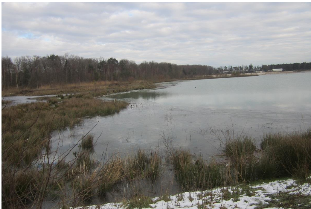
Foto 3: Deelgebied 1A in de noordelijke kweloever is deels afgewerkt en ingericht als ruigteveld en dynamisch moeras