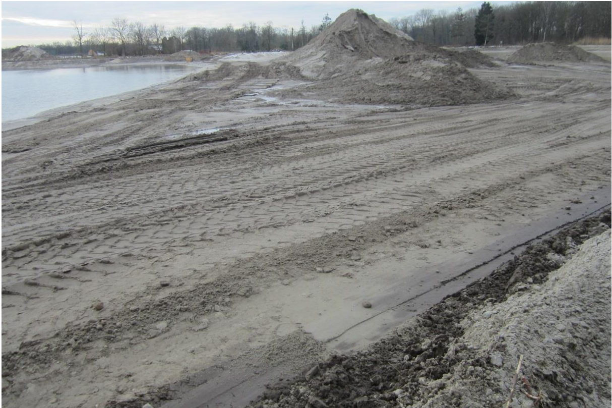
Foto 7: Deelgebied 2 (zuidelijke kweloever) is niet omgevormd tot drie kleine ondiepe plassen en voldoet niet aan het eindplan