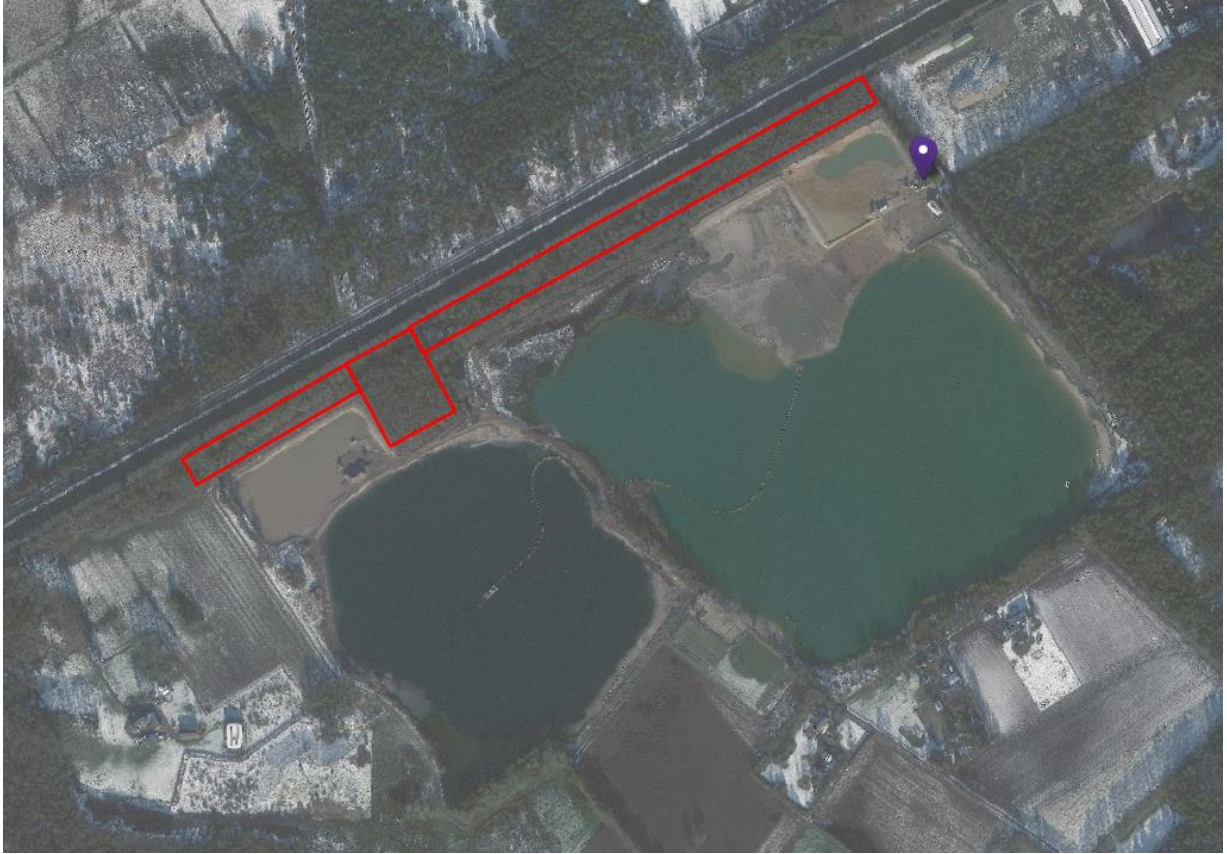
Foto 13: De deelgebieden 9A, 9B en 9C (bosstrook Lozerweg) zijn niet ontgraven