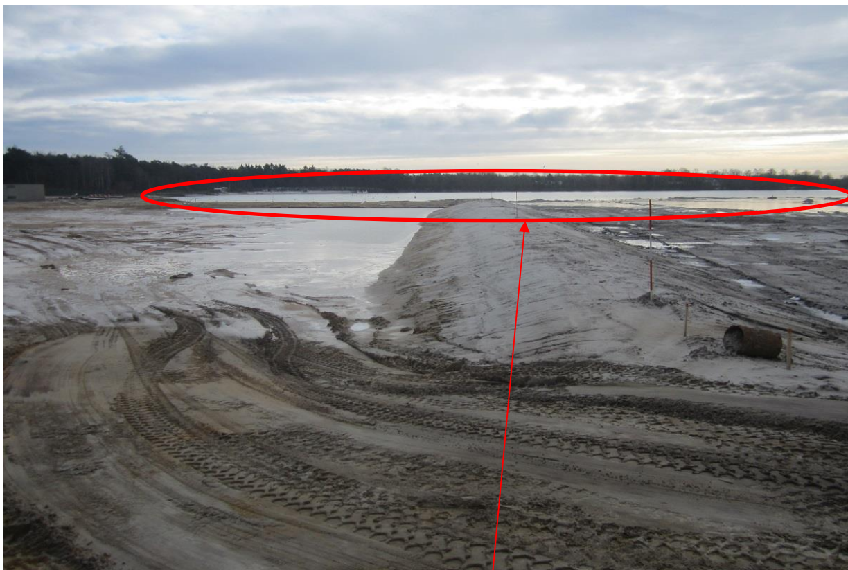
Foto 5: In het noordoosten van deelgebied 1C moet nog specie worden opgespoten om als oppervlak te voldoen aan dynamisch moeras zoals is opgenomen in het eindplan